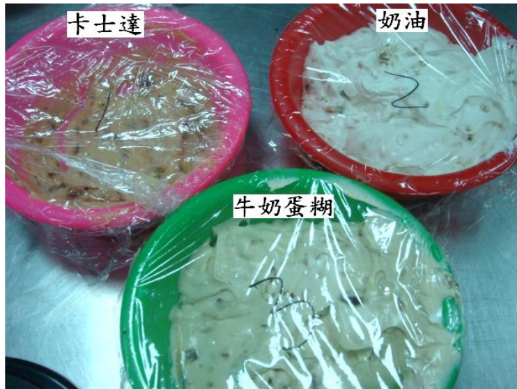
圖 1 牛奶蛋糊、奶油、卡士達三種泡芙內餡配方外觀